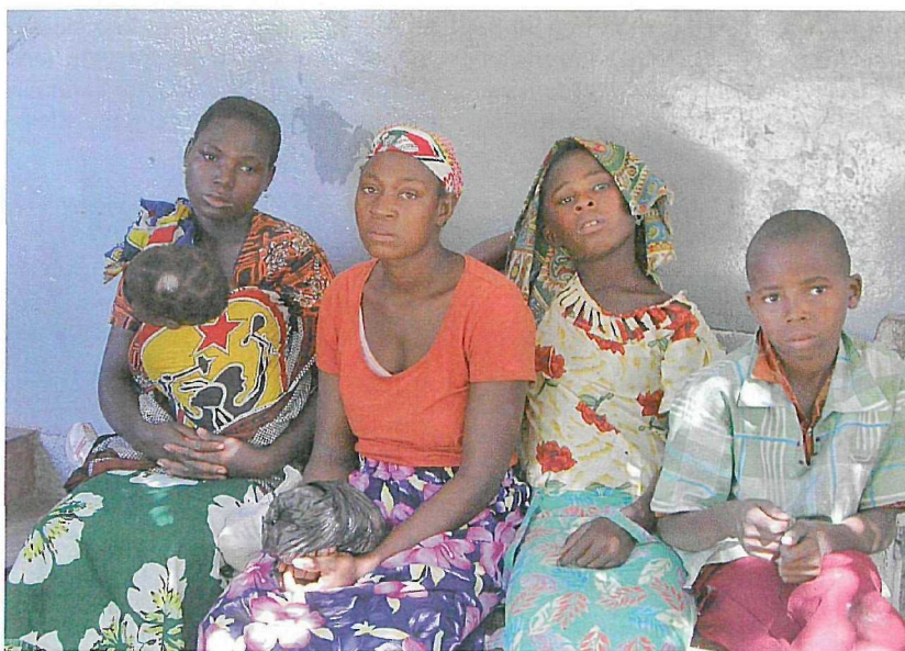
▲ wartende Patientinnen