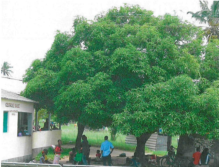
▲ Gesundheitsstation Barada

zu wenig ausgebildete Fachkräfte und hat keine Geburtsstation. Viele Schwangere bleiben ohne medizinische Versorgung und bringen ihre Kinder ohne ausgebildete Geburtshelfer zur Welt – oftmals mit fatalen Folgen.