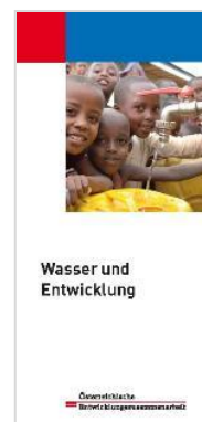
Wasser und Entwicklung