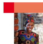
Gemeinsam mehr zusammenbringen

Blitzlichter. Die Welt ist groß genug. Beispiele erfolgreicher Entwicklungszusammenarbeit zivilgesellschaftlicher Organisationen (2016)